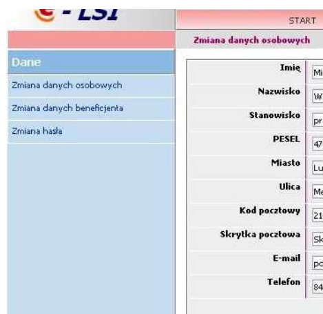
Rys. 6. Podziały wyświetlone w ramach zakładki „Dane”.

W przypadku wejścia na zakładkę „DANE” po prawej stronie ekranu pojawiają się podziały umożliwiające rozszerzenie opcji systemu (Rys. 6.). Występują tam kolejno podziały: „Zmiana danych osobowych”, „Zmiana danych beneficjenta” oraz „Zmiana hasła”. „Zmiana danych osobowych” pozwala na zmianę danych osoby wypełniającej wniosek. „Zmiana danych beneficjenta” pozwala zmienić dane do których przypisywany jest wniosek o dofinansowanie i wnioski o płatność. „Zmiana hasła” pozwala na zmianę hasła dostępowego do konta w www.elsi.lubelskie.pl .